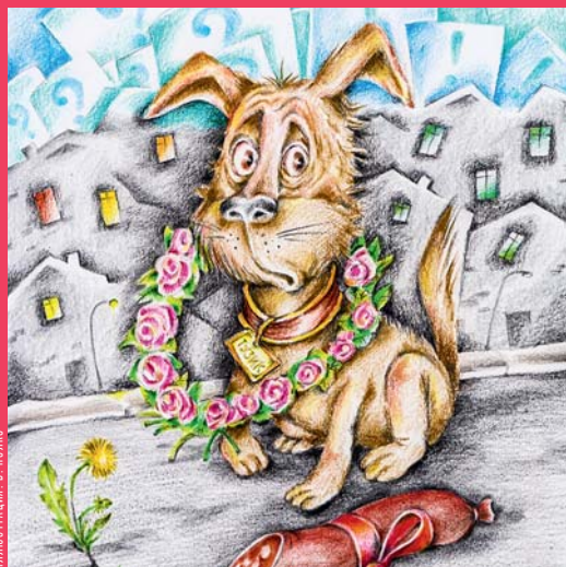
ИЛЛЮСТРАЦИЯ: В. ПОЛОС