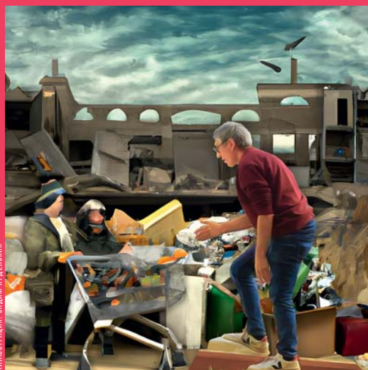
ИЛЛЮСТРАЦИЯ: ВАДИМ КУДЕЛЬКИН