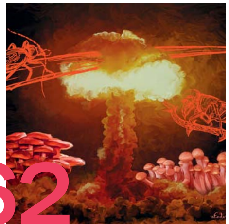
ИЛЛЮСТРАЦИЯ: АНДРЕЙ ФЕДОРЧЕНКО

WEMHÖNER COLLECTION