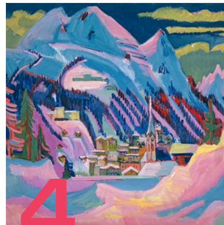
KUNSTMUSEUM BASEL, GESCHENK VON GEORG REINHART, WINTERHUR 1944 / INV. 1951

Часовой клуб: ювелирные украшения От наследства из бабушкиной шкатулки вчера до статуса визитной карточки сегодня 12