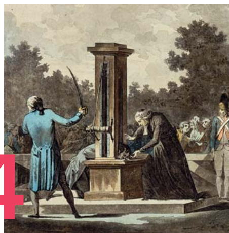
ИЛЛЮСТРАЦИЯ: WIKIMEDIA COMMONS